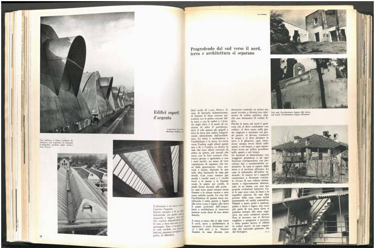
Domus 297, page 18 - 19 contenant l'article Progredendo dal sud verso il nord, terra e architettura si separano , 1954