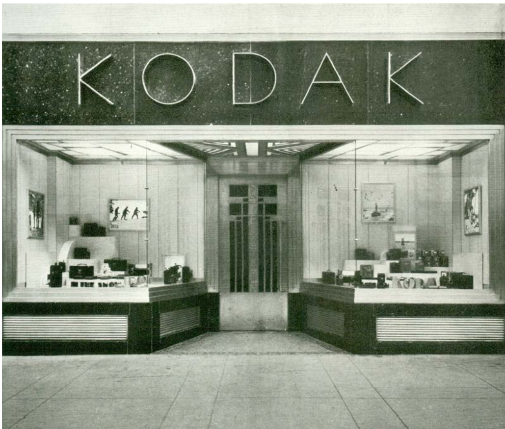
Walter Dorwain Teague, Façade , magasin Kodak, New York, photographie tirée de « The Eastman Kodak Shop, New York City », Architectural Forum Journal , Apr 1931, pp. 449-457.