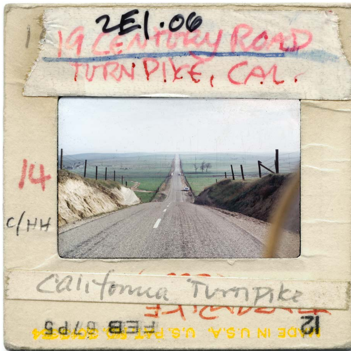
John Brinckerhoff Jackson, « Route du XIX e siècle ; « route à péage », Californie, 1976