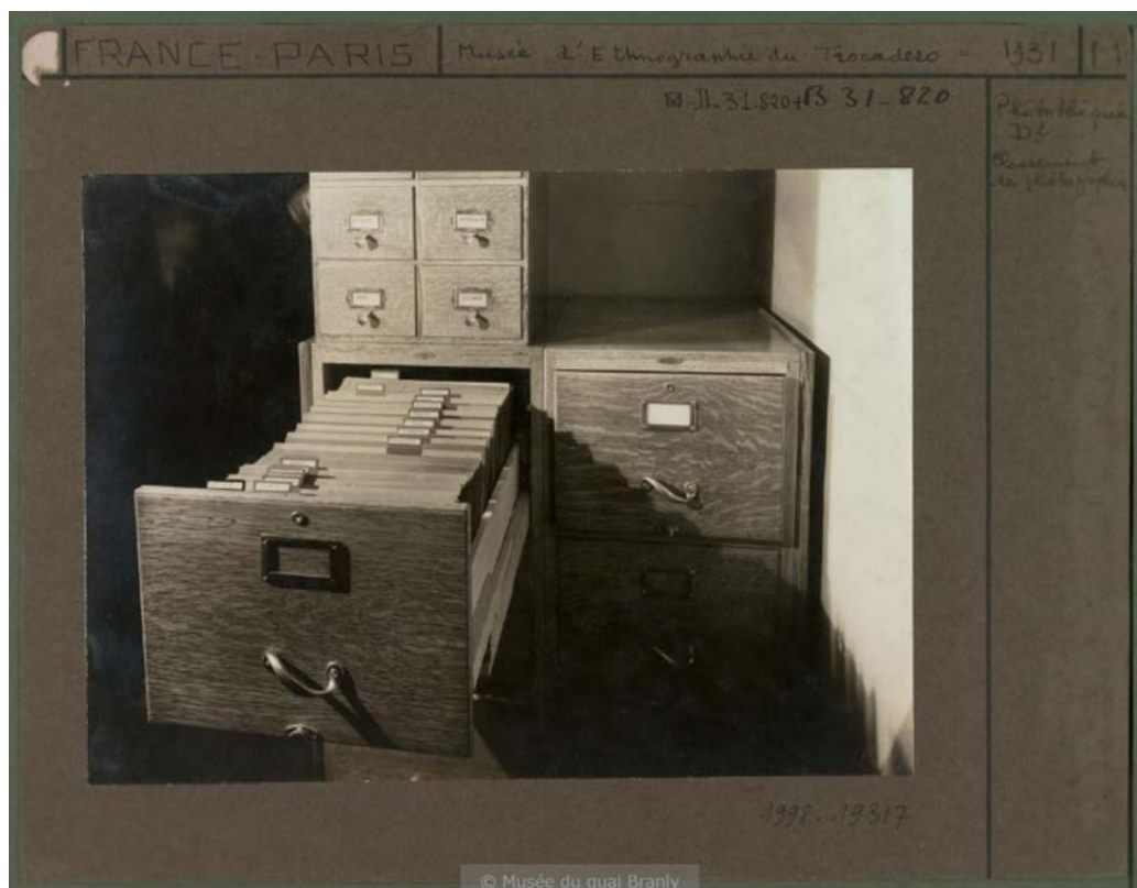
Anonyme, « Vue d'un fichier permettant le classement des tirages photographiques à la photothèque du musée d'ethnographie du Trocadéro », Paris, 1931, tirage sur papier baryté monté sur carton, 22,5 x 29,5 cm.