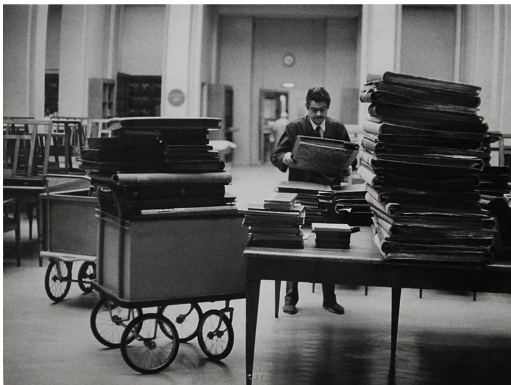
Robert Doisneau, rangement des volumes consultés la veille en salle de lecture du Cabinet des Estampes, Paris, Bibliothèque nationale, 1968, tirage argentique, 18 x 24 cm.